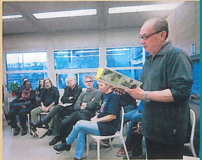
Participatiebijeenkomst Bijlmer Meer (2014).