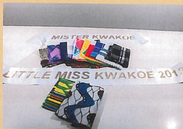
Little Miss Kwakoe. Geschonken door mw. Overman.